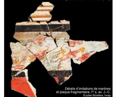
Détails d'imitations de marbres et plaque fragmentaire, I er s. av. J.-C.