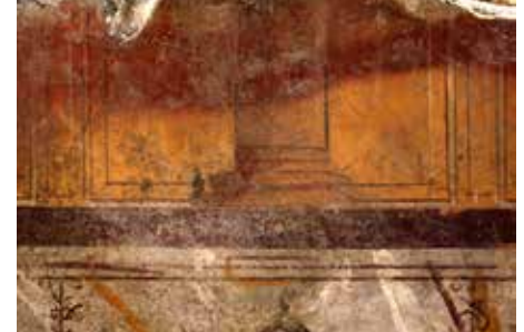
Détail d'une colonne fictive dans l'antichambre.

Véritable trésor archéologique, ces vestiges renouvelleront tout un pan de la recherche toichographologique et enrichiront les collections du musée départemental Arles antique où le visiteur pourra, d'ici quelques années, contempler toute la fraîcheur des couleurs bimillénaires qui ornaient les murs d'un habitat des plus hautes élites de la cité.