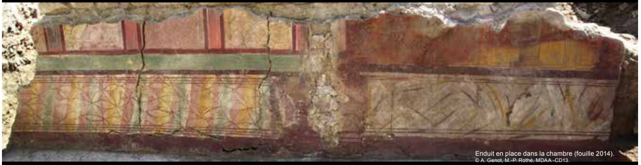
Enduit en place dans la chambre (fouille 2014).

marqué cette année. En effet, la représentation de personnages est extrêmement rare sur des peintures de II e style en Gaule. Quelques fragments ont été trouvés à Narbonne mais la découverte d'un décor aussi riche et offrant un tel potentiel scientifique et muséographique est à ce jour unique en France.