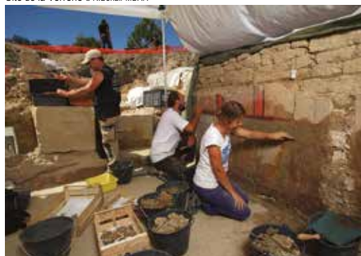
Site de la Verrerie

Un reportage (10 mn) raconte l'opération de fouille sur le site de la Verrerie 2014 : https://www.youtube.com/user/museearlesantique