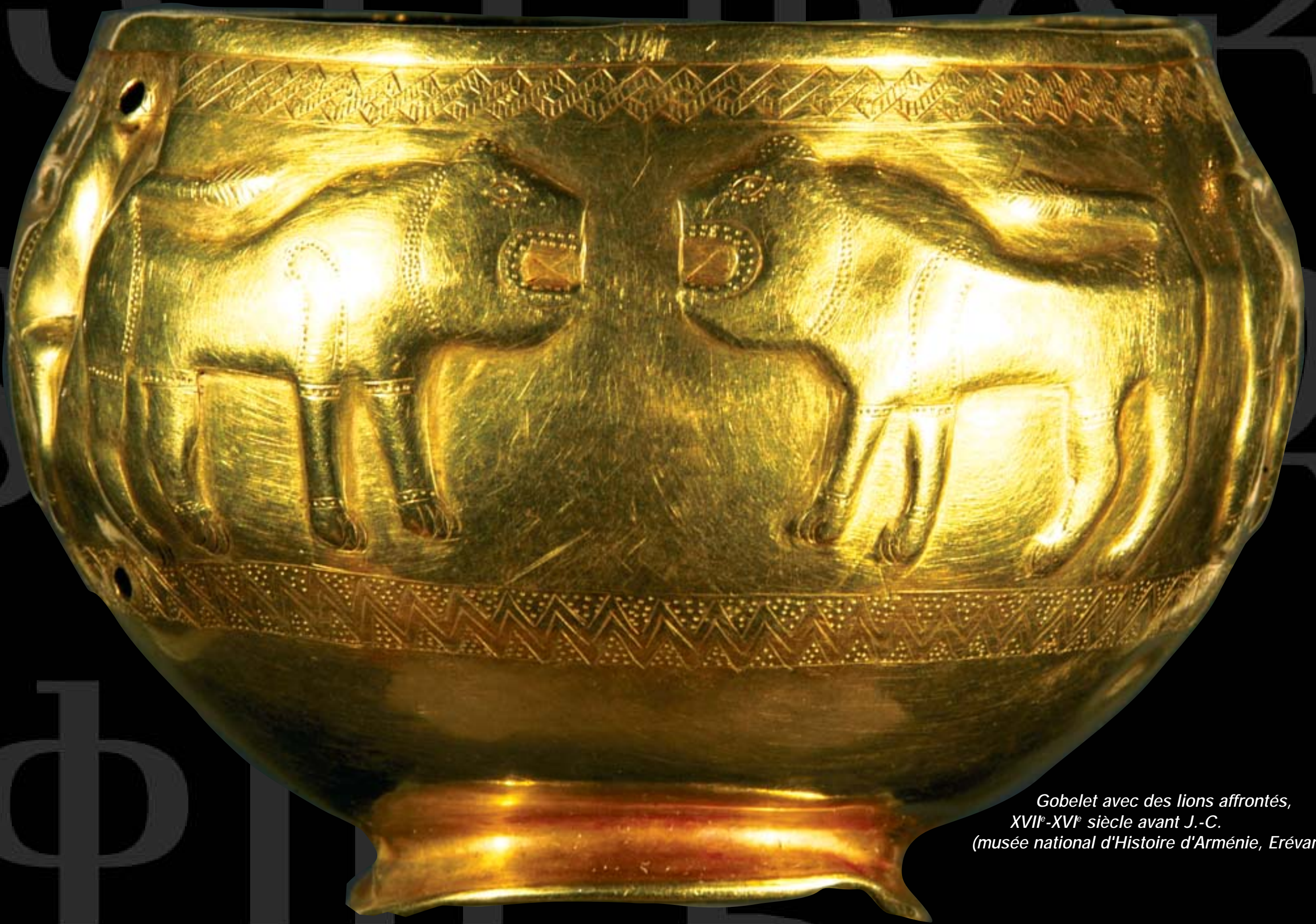
Gobelet avec des lions affrontés, XVII e -XVI e siècle avant J.-C. (musée national d'Histoire d'Arménie, Erévan)

Musée de l'Arles et de la Provence antiques Presqu'île-du-Cirque-Romain, Arles