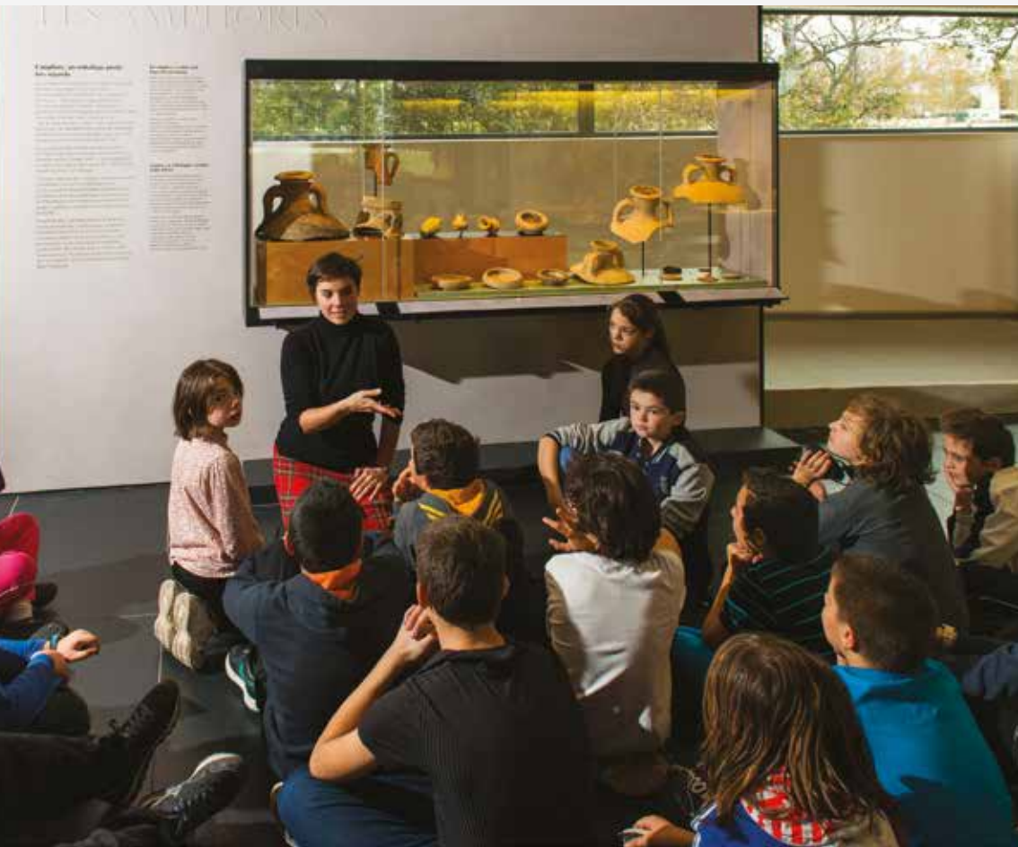
Visite scolaire