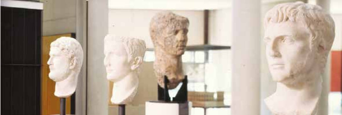
Statue colossale d'Auguste