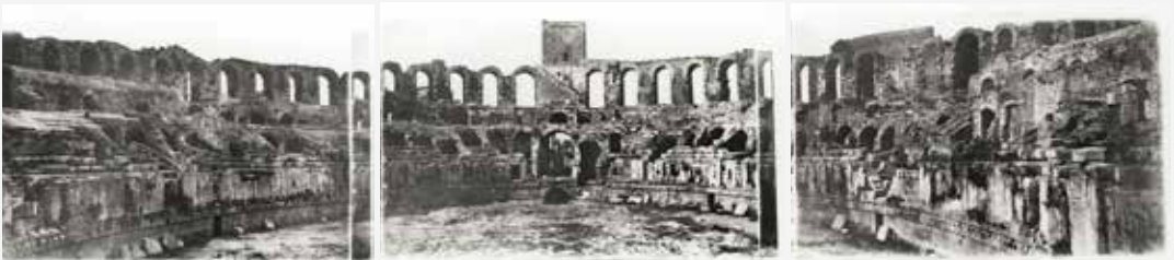
Amphithéâtre d'Arles, Choiselat et Ratel, daguerréotype triple plaque, Coll. Museon Arlaten, dépôt au musée Réattu, Photo © Museon Arlaten