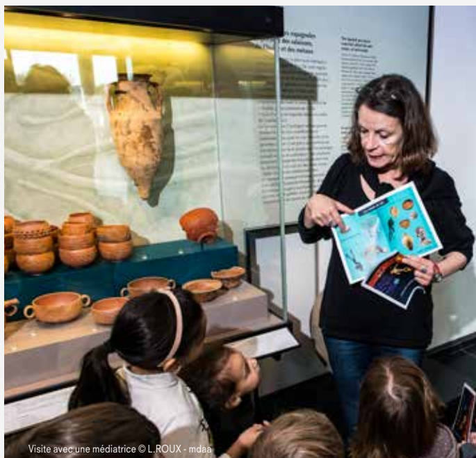
Visite avec une médiatrice

Le médiateur est en quelque sorte un passeur, dont la mission première est de faciliter l'accès pour tous aux collections permanentes, expositions temporaires, activités scientifiques et archéologiques, aux moyens d'outils didactiques, de propositions de visites et de projets sur le long terme.