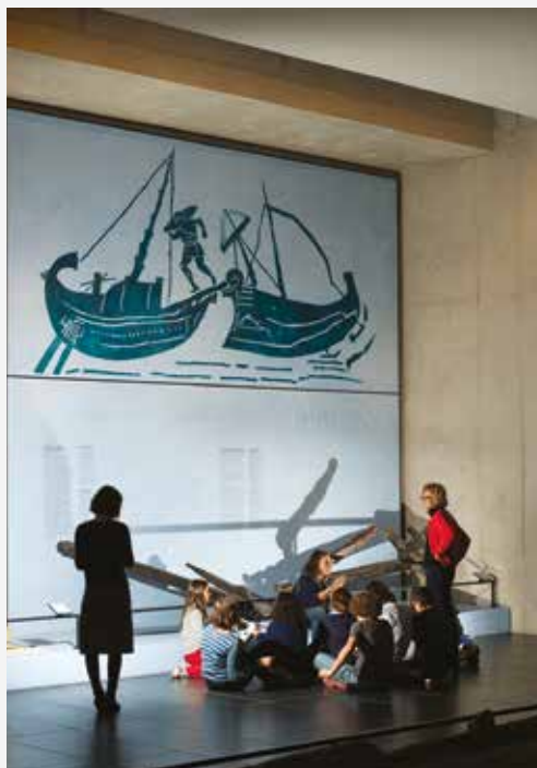
Visite scolaire

Durée : plusieurs séances // CE2 au Lycée Rencontrer un médiateur et préparer son projet Contact Jennifer Ventura : 04 13 31 51 83