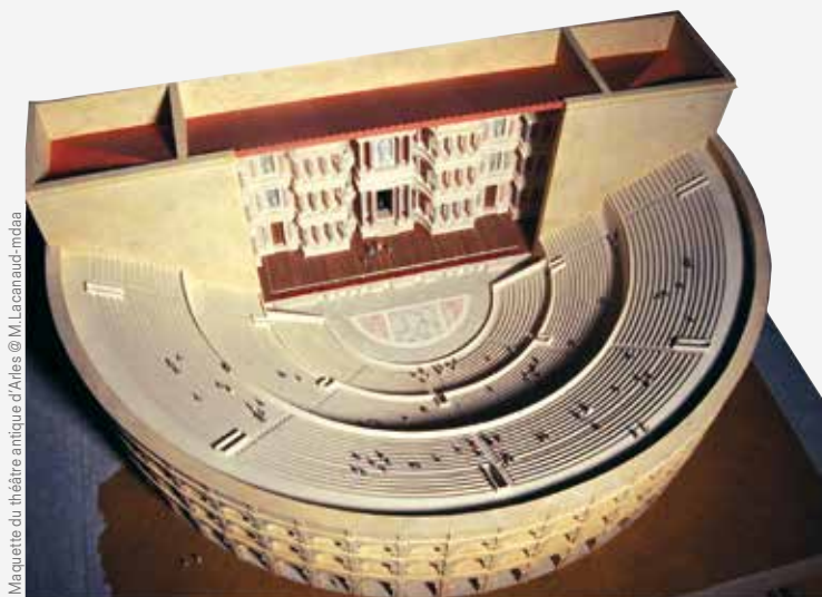
Maquette du théâtre antique d'Arles

Réservation obligatoire auprès de Jennifer Ventura au 04 13 31 51 83