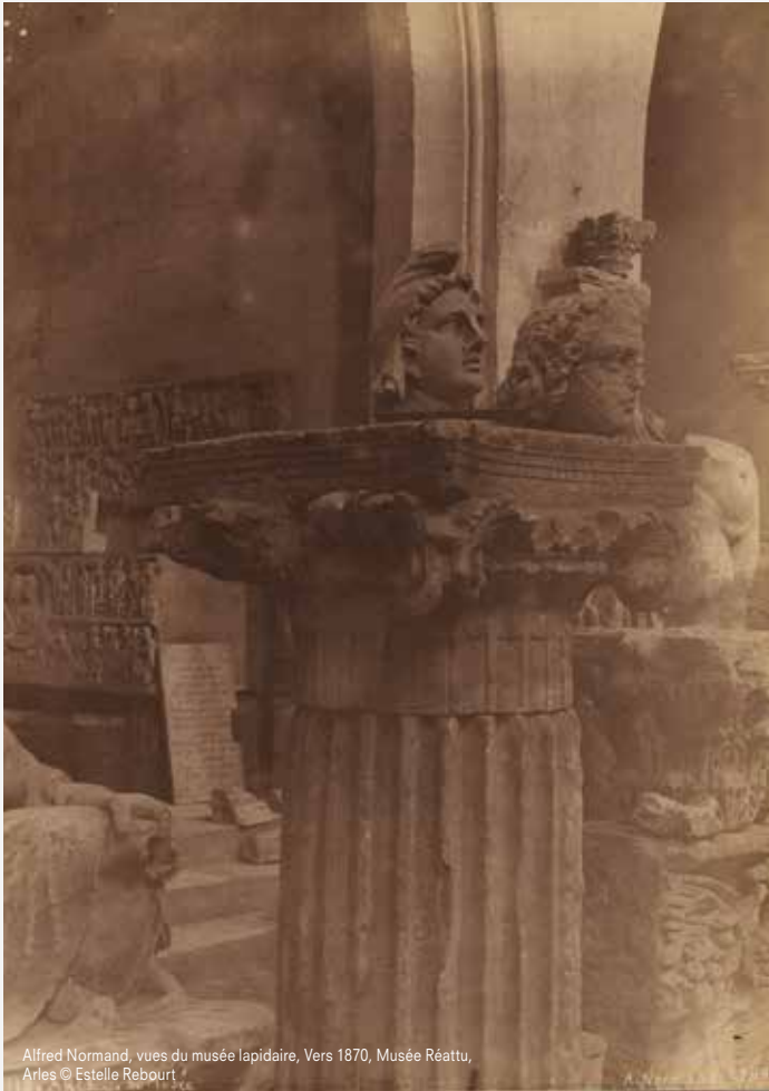
Alfred Normand, vues du musée lapidaire, Vers 1870, Musée Réattu, Arles